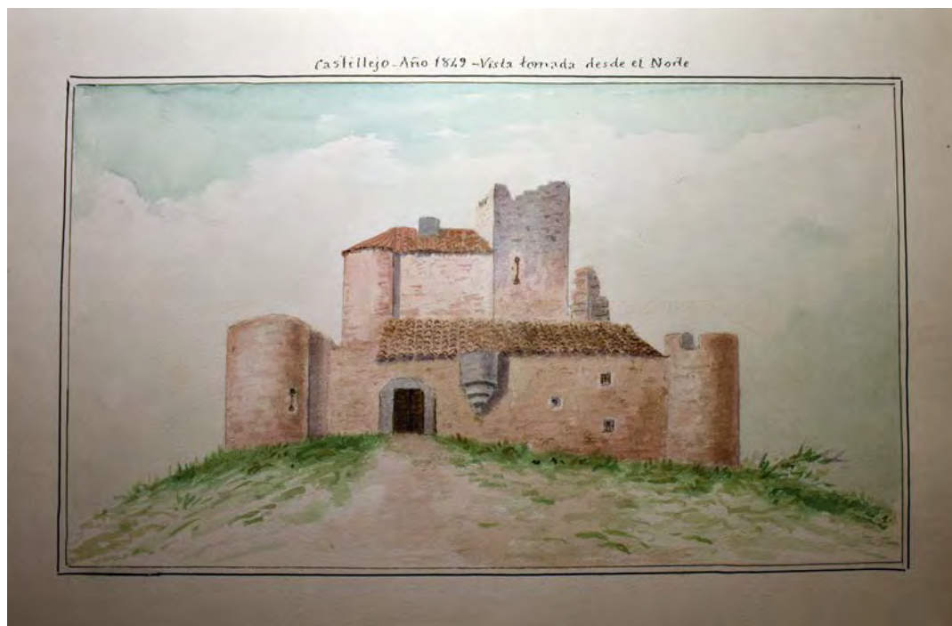
Figura 3. Vista general desde el norte (Doc. nº 3 de la colección)