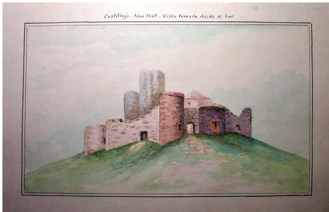
Figura 2. Vista general desde el sur (Doc. nº 13 de la colección).