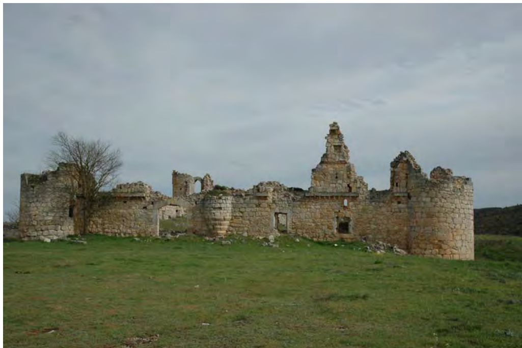
Figura 4. Vista general desde el norte. Fotografía actual