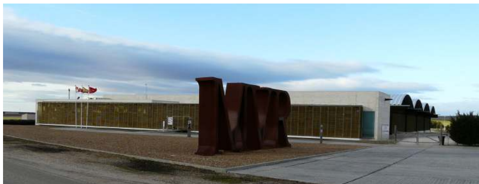
Figura 2. Vista del Museo de las Villas Romanas de Almenara-Puras.

un edificio para Museo y al estudio histórico-arqueológico del yacimiento. En consecuencia se excavó entre 1999 y 2003 una superficie de 7000 m 2 que incluía todo el edificio residencial tardorromano con sus termas y una serie de instalaciones agropecuarias situadas tanto dentro del cerramiento como en el solar destinado a museo. Algunas de esas dependencias rústicas corresponden a las que tuvo la villa tardía, otras son de una anterior; incluso hay una vivienda y algunas estructuras de tipo productivo posteriores al abandono de la pars urbana tardía y al fin de la actividad de sus alas rústicas (García y Sánchez 2015 a: 71-72 y 123-124). Complementariamente se llevó a cabo la restauración de suelos, muros y revestimientos pictóricos y, finalmente, en 2003 se abrió el yacimiento al público y se inauguró el Museo de las Villas Romanas de Almenara-Puras (MVR) que contiene información preparatoria para la visita a la villa. El Proyecto de recuperación ha sido reconocido con la concesión en 2004 de la Medalla Europa Nostra y del Premio AR&PA.