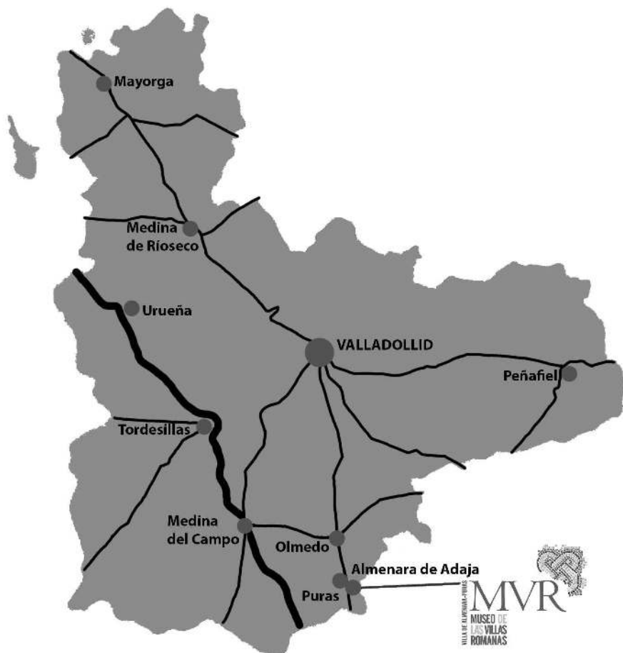
Figura 1. Plano de la provincia de Valladolid con la situación del yacimiento Villa romana de Almenara de Adaja-Puras.

hasta los primeros años del decenio de los noventa, se hicieron otras campañas de excavaciones dirigidas, entre otros, por los profesores A. Balil (entre 1975 y 1983) y T. Mañanes (1989-92), que ampliaron la superficie conocida del área residencial y de las termas y se publicó la primera monografía (Mañanes 1992) 3 .