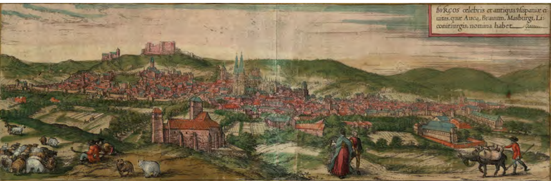
Figura 1. Vista de la ciudad de Burgos en el siglo XVI. Civitates orbis terrarum . Geor Braung, Frans Hogenberg, Hoefnegel, 1572.