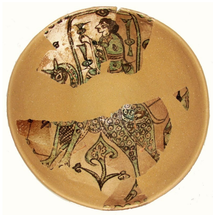
El Atafor de Guadalajara